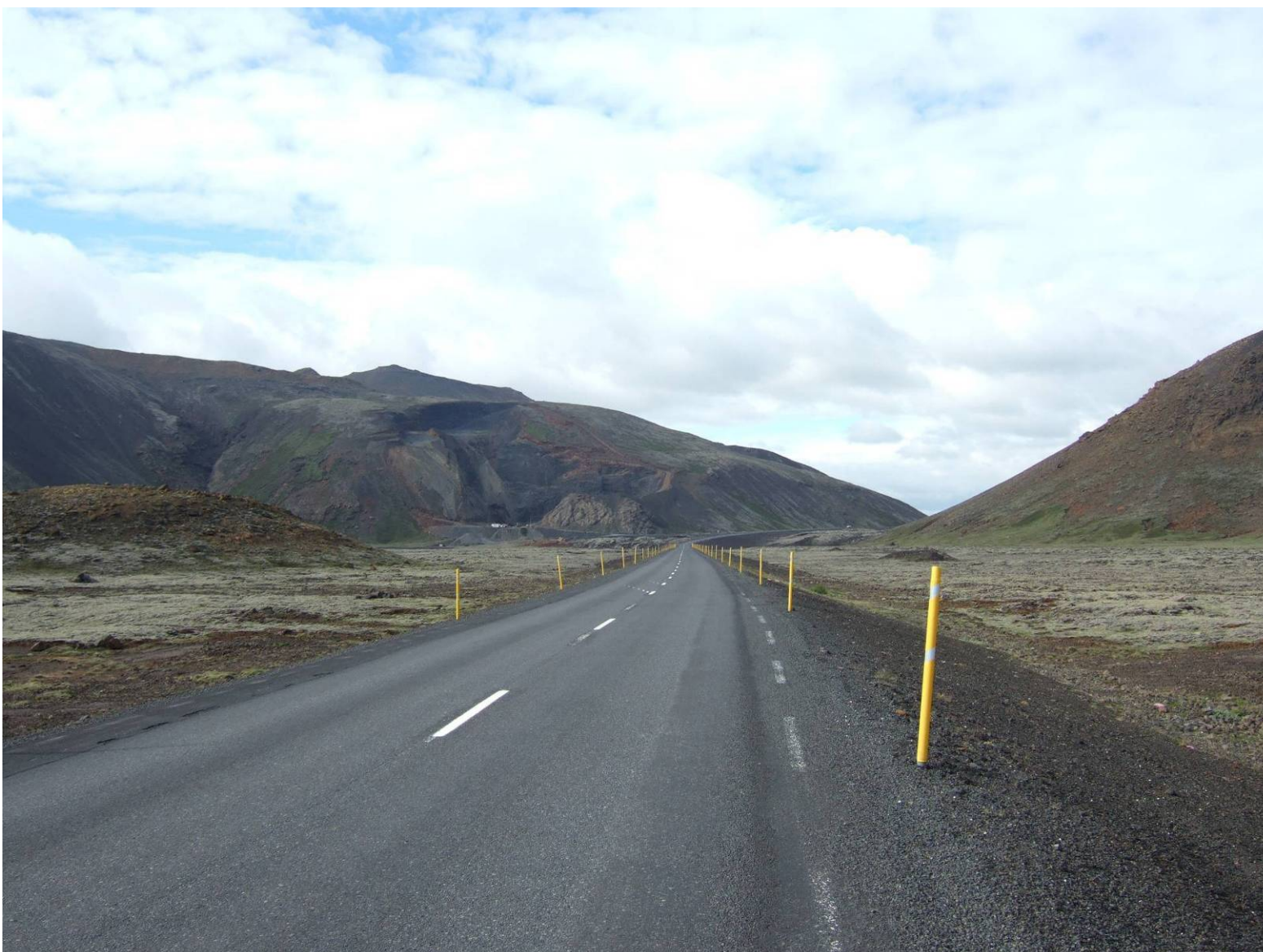
Mynd 2. Myndatökustaður 1 á mynd 1. Horft að Lambafelli frá Prengslavegi. Valkostur 1 mun ekki sjást héðan