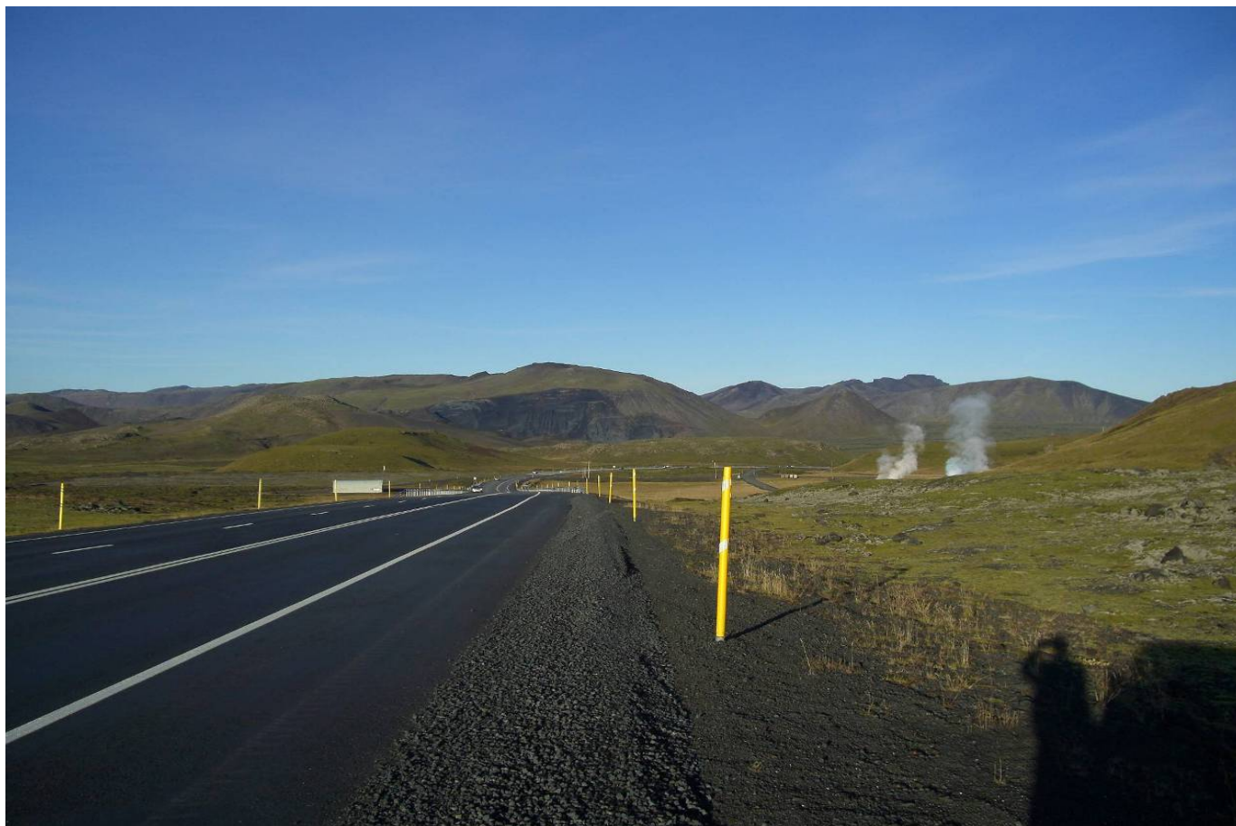
Mynd 12. Útsýni að námunni frá þjóðvegi 1 rétt áður en komið er að Hveradalabrekku (myndatökustaður 3 á mynd 1)