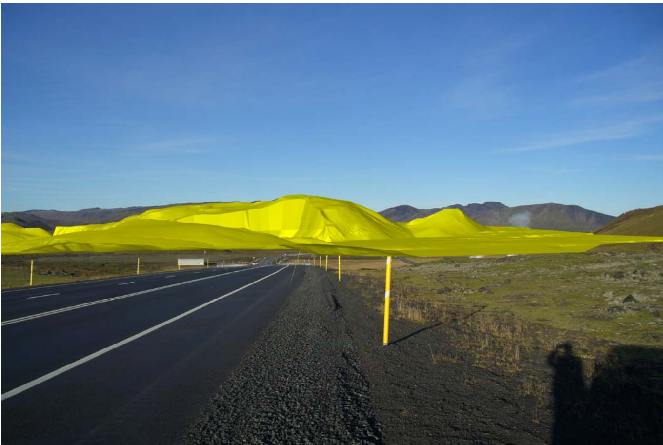
Mynd 7. Líkan frá sama sjónarhorni af námu Árvéla að vinnslu lokinni