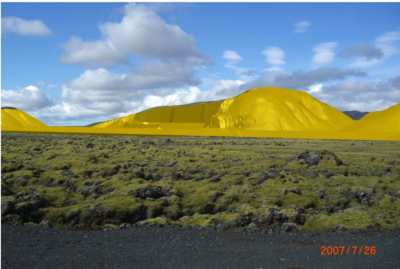
Mynd 4. Líkan frá sama sjónarhorni af námu Árvéla að vinnslu lokinni