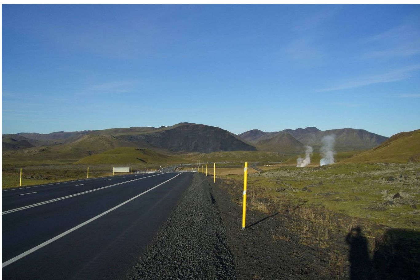
Mynd 14. Áætlað útlit námu Árvéla og Jarðefnaiðnaðarins að vinnslu lokinni