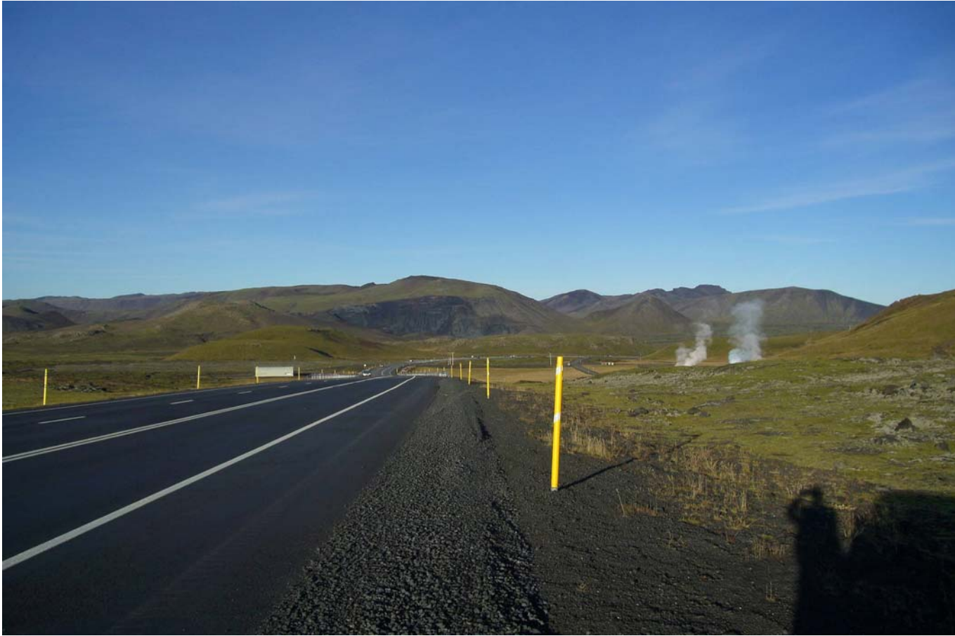
Mynd 6. Útsýni að námunni frá þjóðvegi 1 rétt áður en komið er að Hveradalabrekku (myndatökustaður 3 á mynd 1)