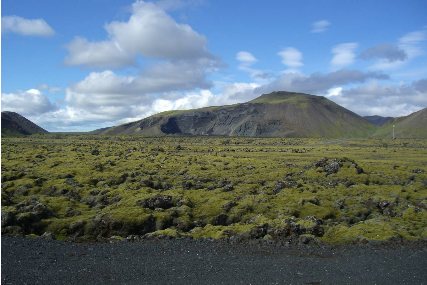
Mynd 9. Útsýni að námunni frá Þjóðvegi 1 í Svínahrauni (myndatökustaður 2 á mynd 1)