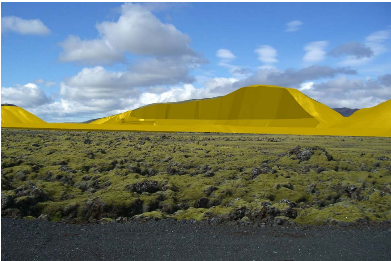
Mynd 10. Líkan frá sama sjónarhorni af námu Árvéla og Jarðefnaiðnaðarins að vinnslu lokinni