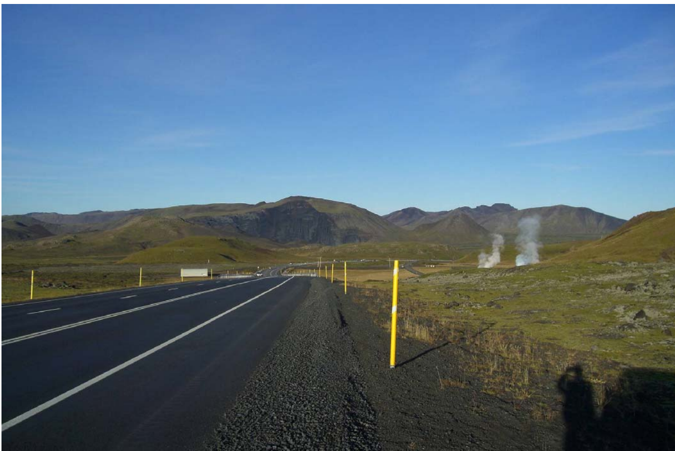
Mynd 8. Áætlað útlit námunnar frá sama sjónarhorni að vinnslu lokinni