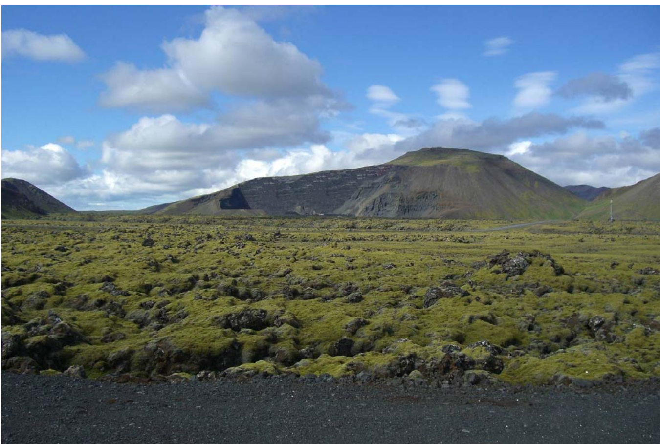
Mynd 5. Áætlað útlit námunnar að vinnslu lokinni frá sama sjónarhorni