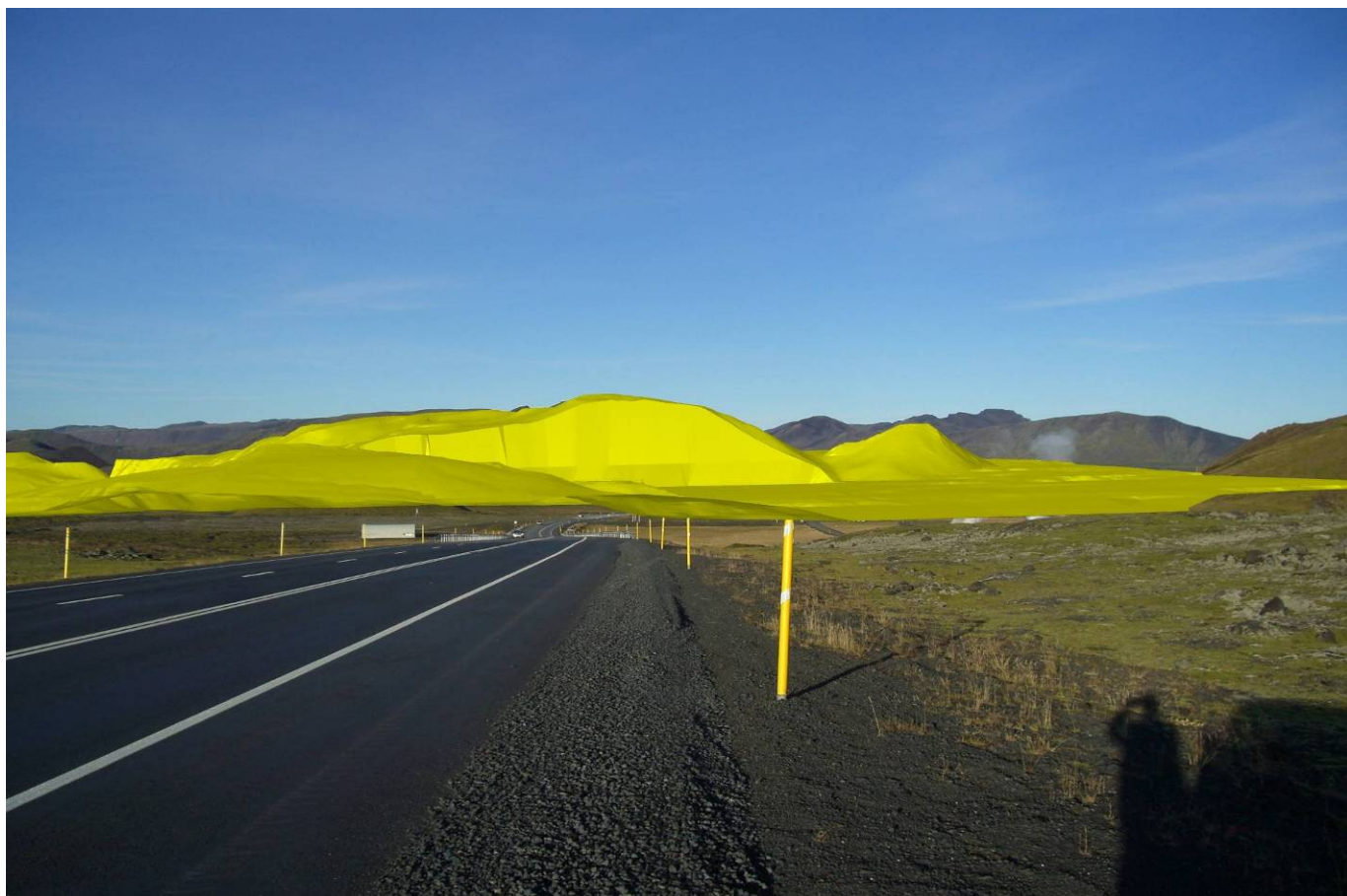
Mynd 13. Líkan frá sama sjónarhorni af námu Árvéla og Jarðefnaiðnaðarins að vinnslu lokinni